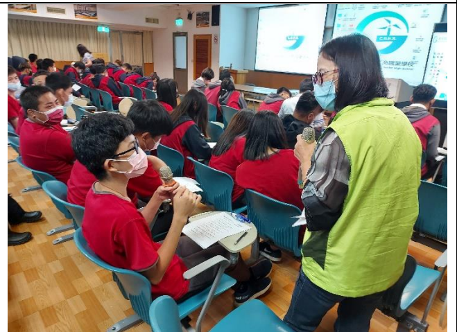
議題討論-同學發表