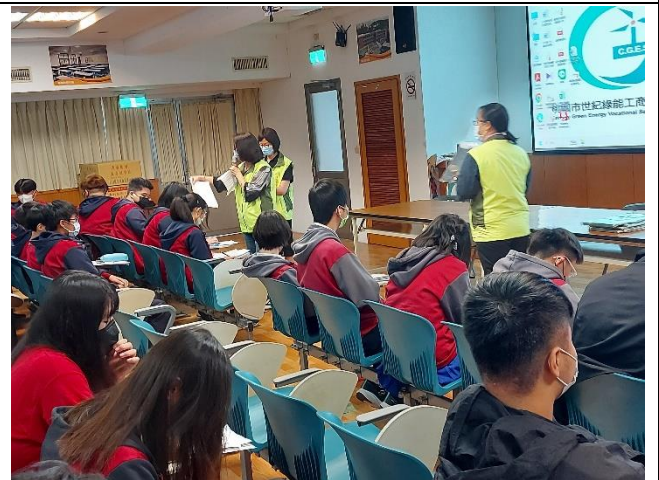
議題討論-同學發表