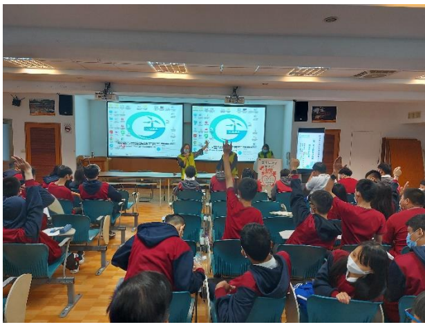
議題討論-同學發表