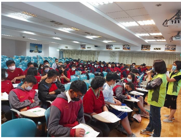
議題討論-同學發表